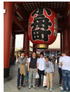
グアム生マルチネス君と

「次に会うときは、英語話すからね」と約束した。そして、息子は夏休みに再会を計画？中。楽しみは、まだまだ続く～ ありがとう！KIRA！ 柏！