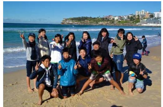
ボンダイビーチで

キャンプハイスクールに自宅の車で行きました。学校ではyear9(日本の中学3年)の授業を受けました。2時間目は理科で実験を行いました。ポテトチップスを燃やしエネルギーを調べました。3時間目は体育でバスケットボールをしました。女子に3回パスをするという特別ルールがありました。自分は2ゴール決める事ができました。下校はスクールバスでした。夜はブッシュダンスパーティーに行きました。パーティーでは、パフォーマンスをした後ダンスをしました。ダンスは独特で、日本ではできない経験をする事ができ、とても楽しかったです。(古賀将敬)