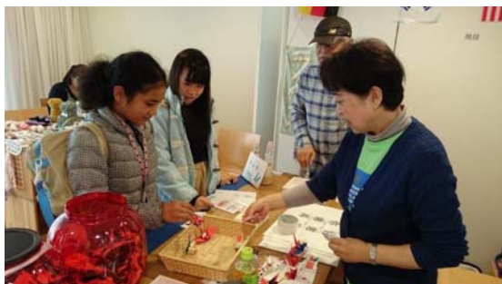
どこの国旗かなあ？

10月21日(土) 柏の葉パークシティ二番街まつりに去年に引き続いて参加しましたが、あいにくの雨で、室内にKIRAブースを出店しました。表通りからは奥まった場所でしたが、子どもたちがたくさん訪れ、サイコロゲームで英語の動物名前当てクイズ、折り紙を使った国旗当てクイズ、多言語挨拶を楽しんでくれました。遊びの中から、少しでも外国への興味、国際感覚の芽が育ってほしいと願っています。