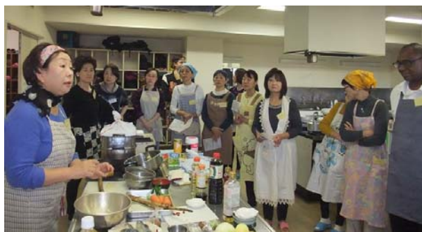
コツを覚えて家でも作りましょう!

サバは熱湯をかけて臭みを取り、皮に切り目を入れると、味がしみ込みやすいこと、ごぼうの皮には栄養とうまみがあるので、あまりきれいにむかないこと、肉じゃがは、水を入れずに、酒と砂糖で煮込み、醤油は後から入れることなど、外国人はもちろん、参加した日本人も「目からウロコ!」の料理のコツを教してもらいました。この