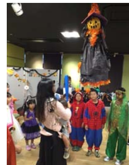
人形のおなかのお菓子をゲット

スパイダーマン、不思議の国のアリス、妖精、魔女、悪霊たちが集合し、パレット柏を回って、お菓子をもらいました。風船アートのカボチャや真綿の蜘蛛の巣などで気分が盛り上がる会場では、真っ赤な唇、大きな口の魔女が歓迎の挨拶をしました。その魔女、実は初めての経験で内心はドキドキだったそうです。続いて、ともにインドネシアのカボチャを使ったゲームとじゃんけんを楽しみました。仮装コンテストの後は、おなかにお菓子が詰まったピニャータと呼ばれる人形が登場、皆で棒で叩いてお菓子を取り出しました。最後に魔女手製の美味しいババロアを食べ、ドラキュラが散会の挨拶をしました。