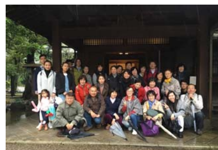
野田市市民会館で

私たちはその後、キッコーマン工場の見学に行き、面白くて楽しい見学の一日が終わりました。