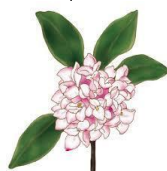
じんちょうげ 沈丁花

にちじ がつはつか げつ しゅくじつ 日時：3月20日(月、祝日) 13:00~14:30 ばしょ かしわ 場所：パレット 柏 オープンスペース もう こ 申し込み：3/10 までに KCC へ メール boshu-2@kira-kira.jp