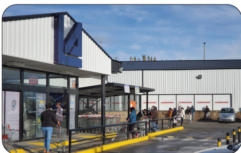
スーパーの入場制限

このように全国で感染者が急増した背景は、拙速な活動再開を指示した首都圏以外の市長たちの対応だと指摘されています。日本の現状とはだいぶ違うと思いますが、早く感染拡大が収まり、Withコロナの生活が全世界にもたらされること切望しております。