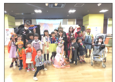
色とりどりのコスチューム

パーティーが始まると、スタッフの英語の呼びかけに子どもたちは元気に応え、スクリーンに映されたメキシコのハロウィンの動画にあわせて、大人も子どもも骸骨の気分で愉快地踊りました。次に2つのグループに分かれて、目隠しをしてボードに各部分の骨を置いて骸骨を形作るゲームをしました。ファッションショーでは、賞を取れなかった子どもたちも、スタッフ手作りのメダルをもらって嬉しそうでした。最後にピニャータ（日本のくす玉のような物、中に菓子を入れ上から吊して、子どもたちが棒で叩いて割る）を割って、お菓子を分け合いました。皆で楽しく笑顔で過ごした一時でした。