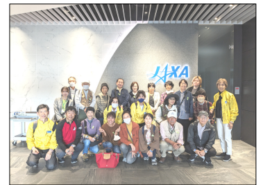
13「きぼう」運用管制室前で

午後はエキスポセンターに移動し、団体予約した休憩室で昼食をとりながら、参加者同士で歓談し、展示場の自由見学後、世界最大級のプラネタリウムで「今日の星空」を鑑賞し、楽しく有意義な一日を過ごすことができました。