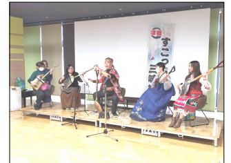
津軽すこっぷ三味線