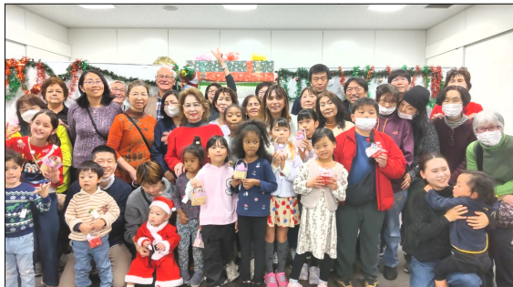
みんなでメリークリスマス！

影絵は10分ほどの内容でしたが、子どもたちは小さな枠の中の影の動きに集中して、イギリスのお話「3匹のくま」を楽しんでいたようです。影絵の後はメキシコのゲームやピニャータを割ってお菓子をもらうなど、大人も子どももとても楽しい一日でした。