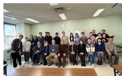
沼南教室学習発表会

発表終了後は参加者がグループを作り、発表の感想を述べあったり、自己紹介をするなどして交流を深め、楽しく歓談し、正午には解散しました。