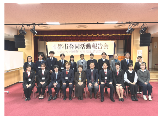
四都市合同活動報告会

私たち柏市国際交流協会は、若者が、早い機会に姉妹・友好都市を訪ねて異文化を経験し、国際性を磨き、また両国の友好の懸け橋となってくれるように、支援活動をし、それを喜びとしております。来年以降ふるって派遣に応募されることを願っております。