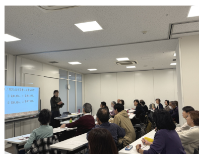
よりよい指導を目指して！

特にグループワークで複数のイラスト案について学習者が助詞の機能を理解するのに適切かどうかを検討したり、学習者の理解を深めるための例文作りの議論を通じて、私たち自身の理解が深まるのを実感しました。