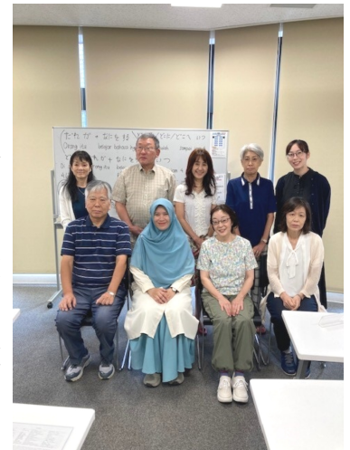
インドネシア語講座 講師と受講生

（この他に、英語、中国語、韓国語、スペイン語の講座を開講しています。詳細は、かわら版やホームページを参照してください）