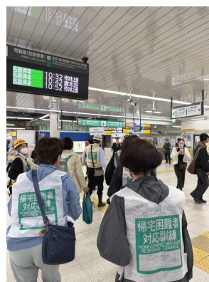
電車が動かない。 さあパレットへ！

柏駅東口ダブルデッキに集合した参加者は、帰宅困難者になったことを想定して柏駅に移動し、そこでシェイクアウト訓練を行いました。この訓練は大地震の揺れから身を守る訓練です。まず体を低くし、頭を守り、動かないという訓練に参加者全員で行いました。その後、KIRAの日本人3名と外国人3名は、一時滞在施設のパレット柏まで、歩いて移動しました。パレットでは、防災グッズのいろいろな情報をいただきました。各家庭でも日頃から防災グッズの準備など常に気を付けておくことが必要だと思います。今回、聴覚障害者のための手話通訳や要約筆記は行われましたが、外国人のための多言語対応もあるとよかったですと思います。